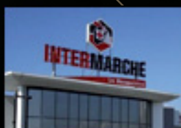
Intermarché Port Sainte Marie (47130) Supermarché Superficie : 1 426 m 2