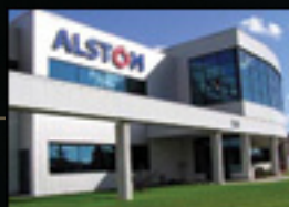
ALSTOM Vitrolles - Les Chênes (13127) Conception de produits domaine des transports Superficie : 1 634 m 2