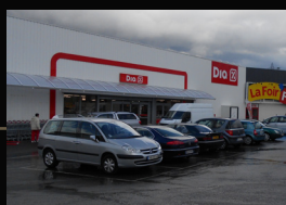
Supermarché DIA Beauvais (60000) Supermarché alimentaire Superficie : 1 763 m 2