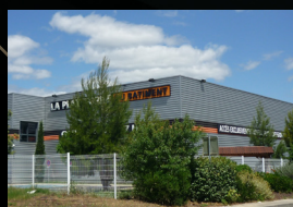
Plateforme du Bâtiment Montpellier (34000) Négoce de matériaux pour le bâtiment Superficie : 5 877 m 2