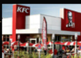
KFC Ennetieres en Weppes (59320) Restauration rapide Superficie : 772 m 2

Plus de 70.000 m 2 de locaux repartis sur tout le territoire français (dont 30.000 m 2 en région PACA, 15.000 m 2 en région parisienne)